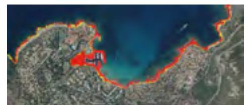
Atlas de submersion marine