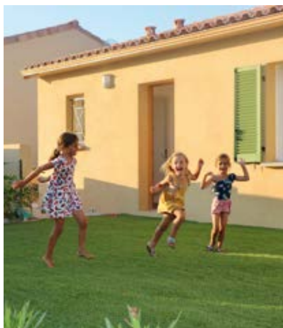
Les fillettes de la famille Dauga en pleine séance vitalité !

L'édification de la nouvelle résidence Campà inseme 2 se prospecte à son tour au lieu-dit Schinali, route du bord de mer. Suite à l'approbation du PLU de la commune, le permis d'aménager a été déposé. Il est en cours d'instruction et comporte 11 lots à prix maîtrisés et 7 lots libres. Ces logements seront éligibles à la subvention réservée aux primo-accédants mise en place par la collectivité de Corse.